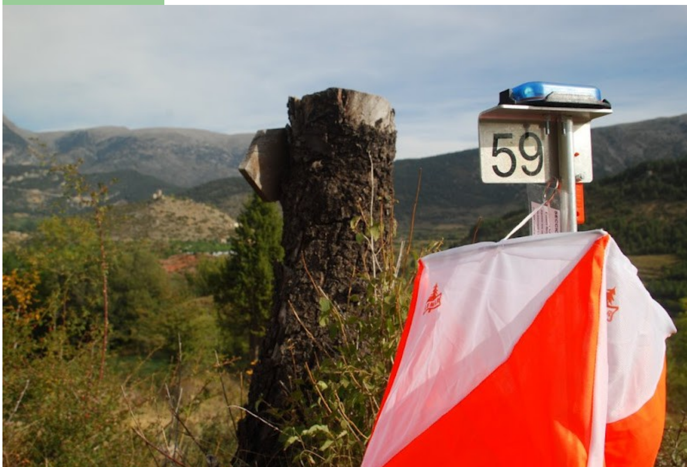
Balisa col·locada als prats de la població de Gòsol.