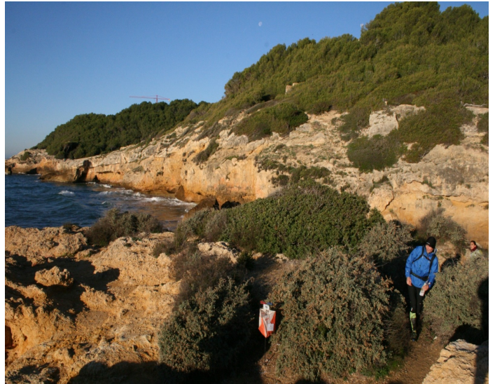
Un control i alguns participants del rogaine.

En resum, va ser un rogaine amb força participació tot i ser la seva 1a edició.