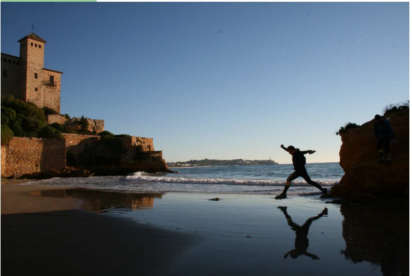
Foto del Rogaine Baix Gaià, guanyadora del concurs de fotografia FCOC 2012.

CRÒNIQUES DE LES ÚLTIMES CURSES DE COPA CAT.