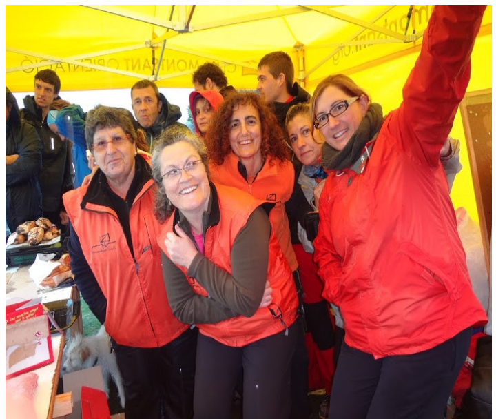
Moment d'aixopluc de la cursa.