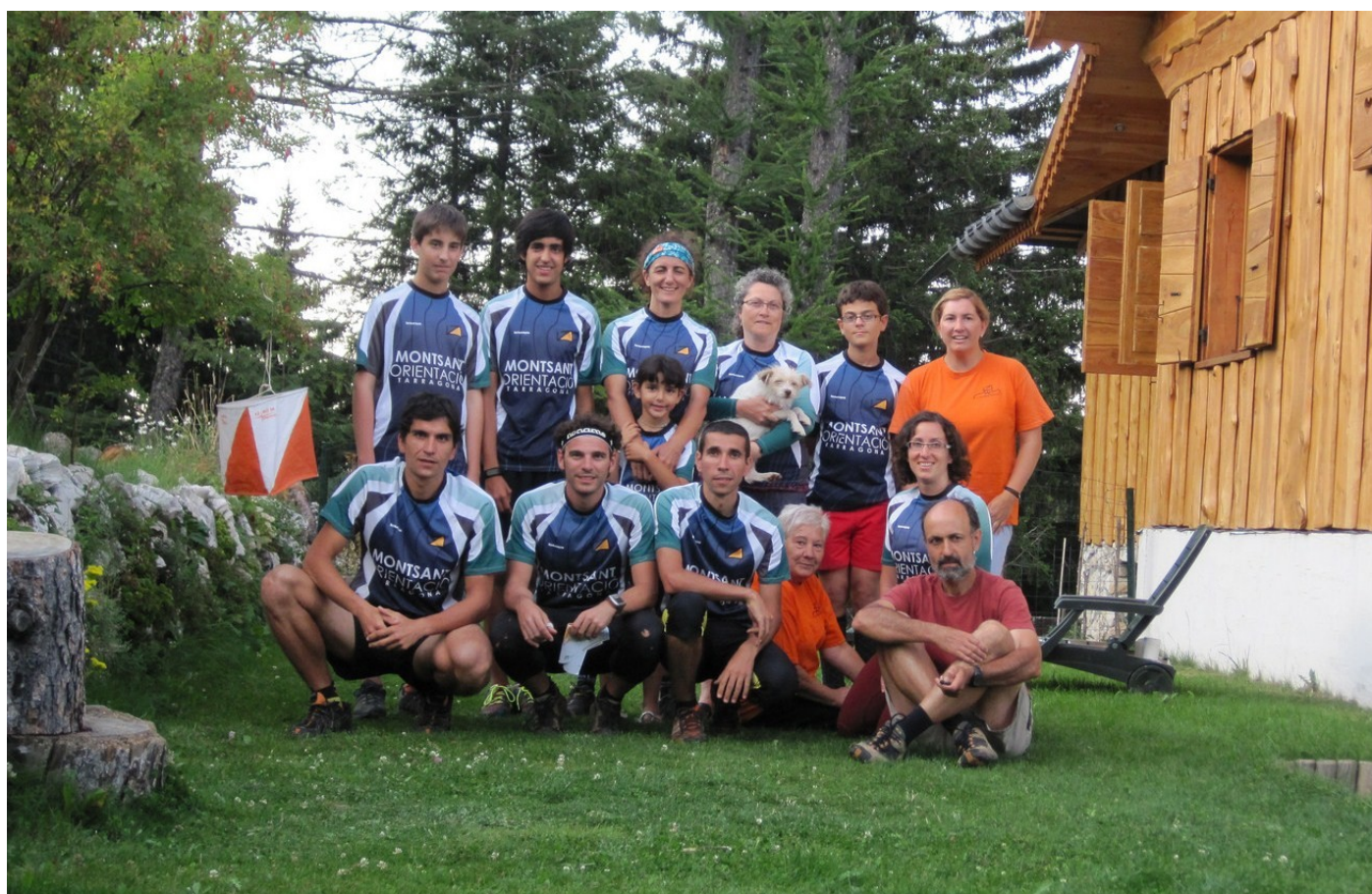
Grup de montsant que varen participar al O'FESTIVAL ERDF de França 2011. (WOC'11)