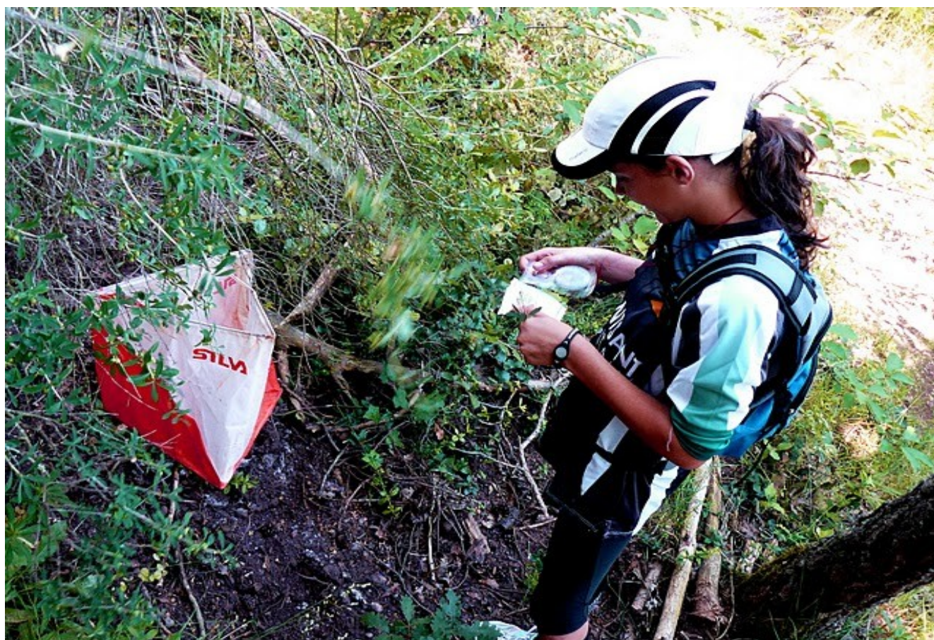
Competidora de l'equip júnior en un stage d'entrenaments.