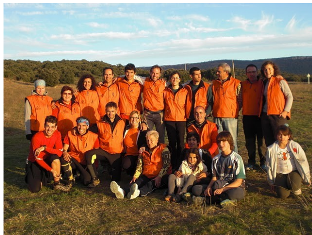
Club Montsant quasi al complet als Segalassos

A l'estiu un grup d'orientadors del club va aventurar-se fins a Finlàndia durant dues setmanes, on van poder realitzar entrenaments en els paratges d'aquest país. I també varen participar en la competició FIN5, una competició mundial de 5 dies de curses que van valdre molt la pena a aquests orientadors per millorar considerablement la seva tècnica d'orientació. Va ser una increïble experiència per ells.