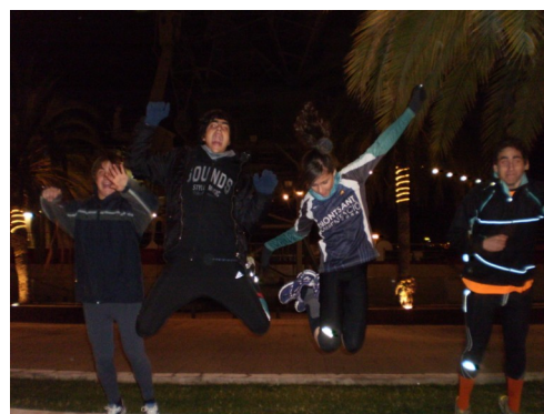
El salt habitual del Junior Team

C U R S A U T W G T W D U B E M O C I O A R B E A R T L F L O V E S I N B A S M R S Z U R P C I A