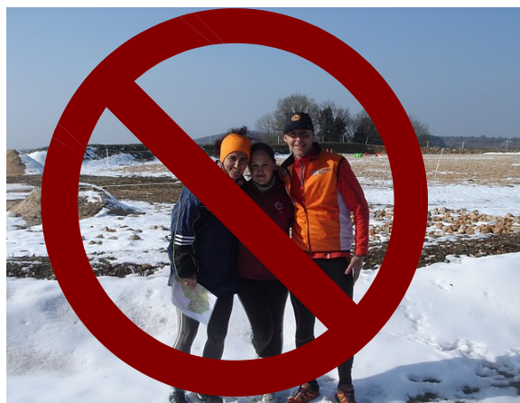
Orientadors desafiant la neu.

d'acord per a poder practicar bé l'esport de l'orientació. Però, compte que el mes de Març vingui la primavera, no significa que no faci fred, sinó que encarar queden dies amb fred i alguna que altra cursa que ens haurem de tapar bé, sinó volem agafar un bon refredat. Així que aprofiteu el bon temps per a practicar el nostre esport que ens agrada tant, l'orientació!