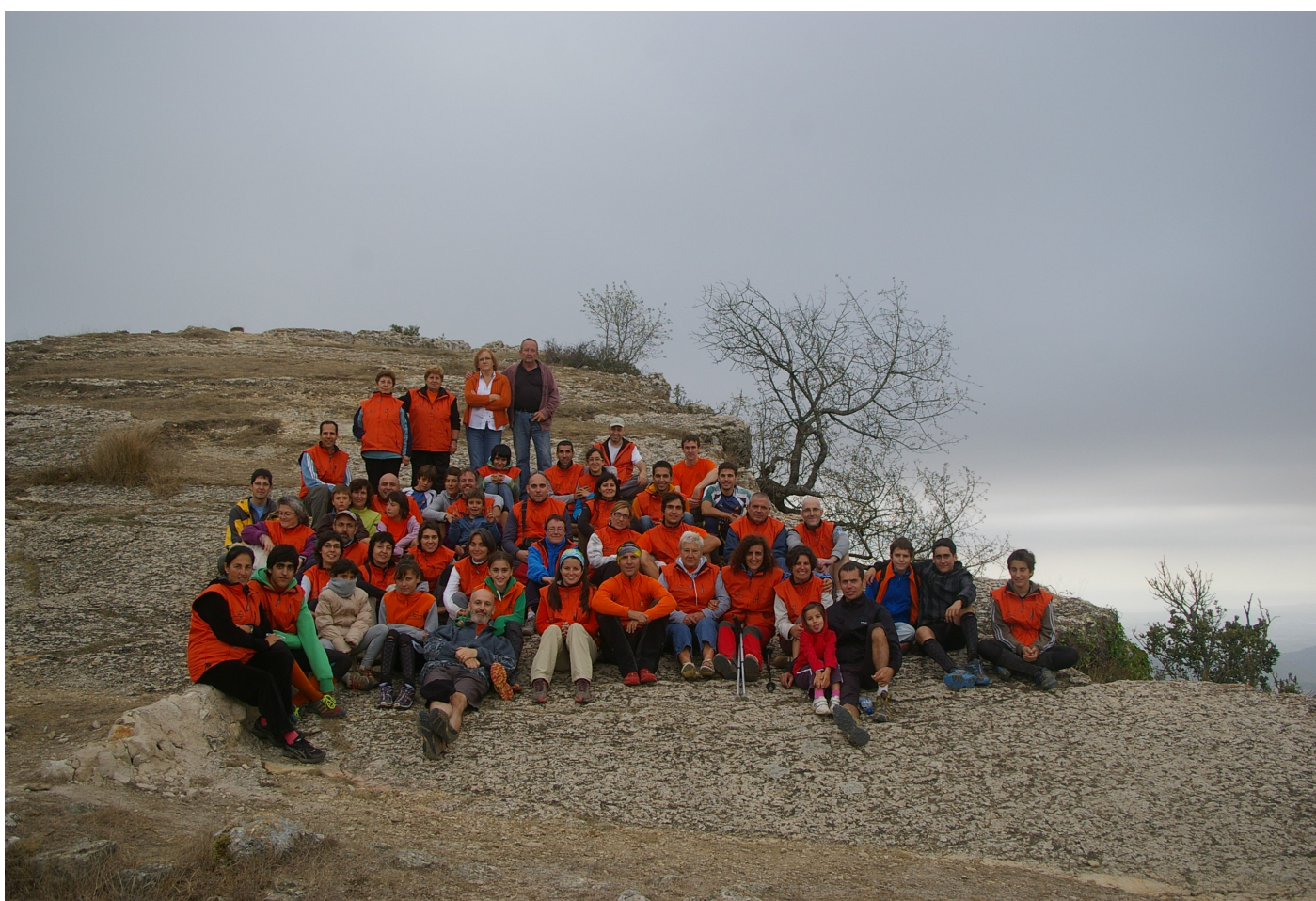
Club Montsant a la Mussara.

CRÒNI- QUES: BTT- O A VIC, I DE LA MUS- SARA.